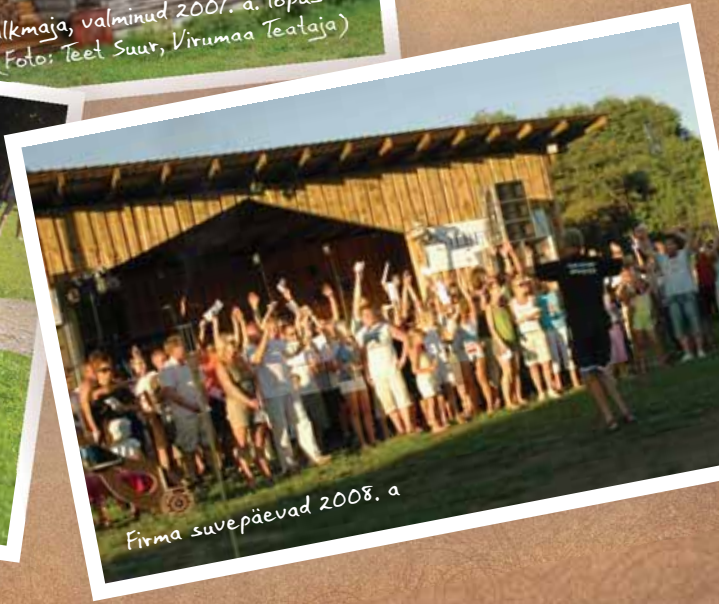
Firma suvepäevad 2008. a