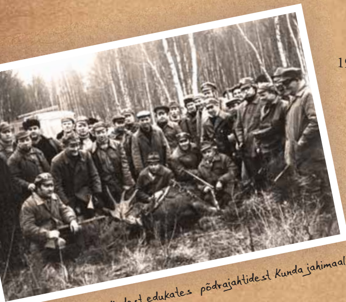
Üks paljudest edukates põdrajahtidest Kunda jahimaal