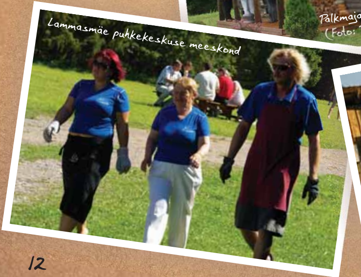
Lamasmäe puhkekeskuse meeskond