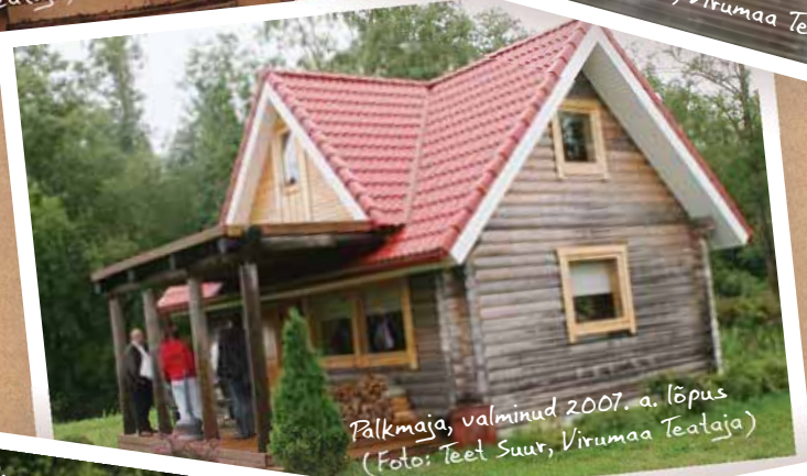
Palkmaja, valminud 2007. a. lõpus