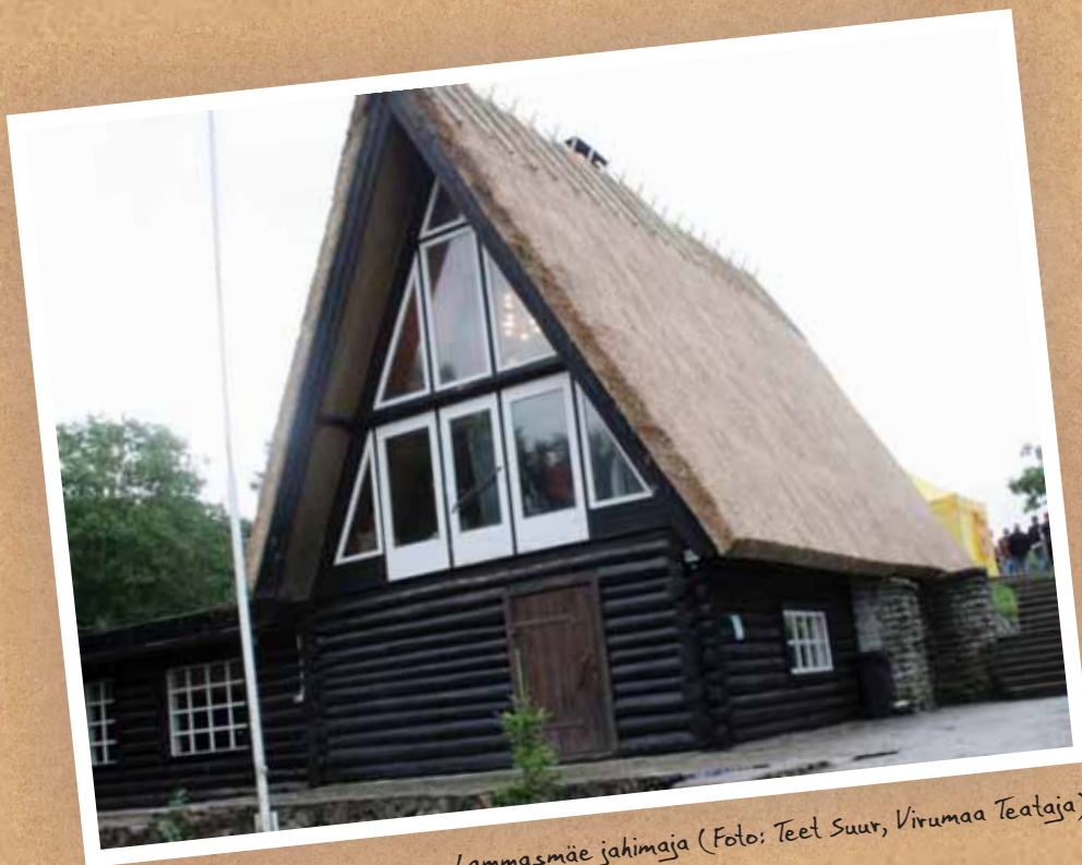
Lammasmäe jahimaja

Baltimaade I hüdroelektrijaam, liigirohkes pargis asuv kivikirik , endine tehase direktorite mõis , seitse Soucantoni kaju , samuti Toolse linnuse keskaegsed varemed , tsemendimuuseum, põhjaranniku kaunid rannad ja rohevööndid ning palju-palju muud huvitavat.