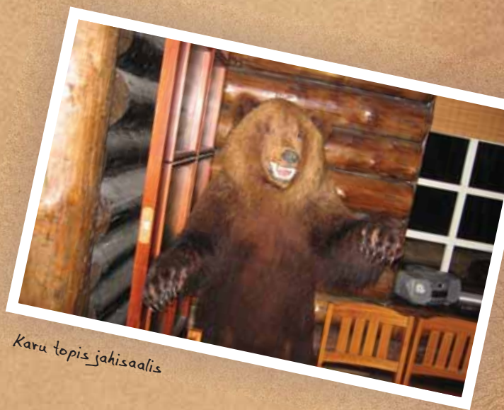
Karu topis jahisaalis

Suvistel õhtutundidel sobib mõnusaks olemiseks grillkoda . Pillimeestele ja tantsugruppidele esinemiseks ning pidulistele muusika ja tantsu paremaks nautimiseks on ehitatud lava . Maakividest kamina juures jõekäärus saab nautida nii vete vulinat ja linnulaulu kui ka pisikest piknikku pidada. Külaliste majutamiseks on puhkekeskuses palkmajad ja suvemajad .