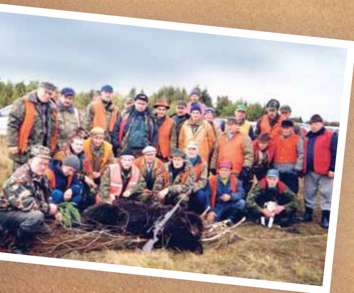
Pärast edukat karujakti