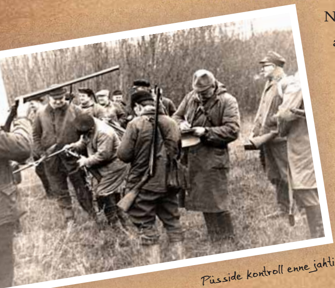
Püsside kontroll enne jahti

1960ndate aastate alguses andis Kunda tsemenditehas igale tsehhiile võimaluse rajada endale puhkebaas. Esimese sauna Lammasmäele ehitas tehase mäetsehhi. Seda ära kasutades valisid kohalikud jahimehed endale lasketiiru asukohaks samuti Lammasmäe.