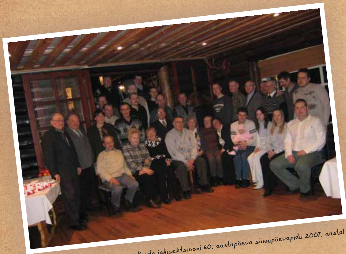
Kunda jahisektsiooni 60. aastapäeva sünnipäevapidu 2007. aastal

Tänapäeval on Lammasmäe jahimaja säilinud toreدا puhkekohana, mis areneb ja täieneb nagu algusaastatel, meelitades kohale külalisi nii lähedalt kui ka kaugemalt.